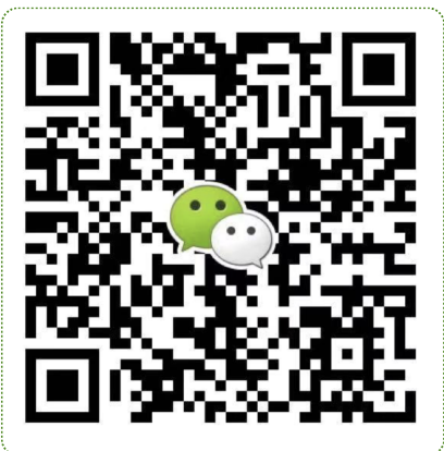
● 华北华东地区及海外咨询 滕老师