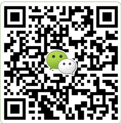
● 华南地区及海外咨询 叶老师